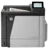
HP Color LaserJet Enterprise M651dn