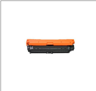
CÔTÉ GAUCHE CARTOUCHE