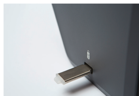
La fonction de numérisation vers une clé USB offre la possibilité de connecter une clé de stockage externe jusqu'à 64 Go afin que les utilisateurs puissent instantanément numériser leurs documents en mode nomade sans avoir à passer par leur PC.