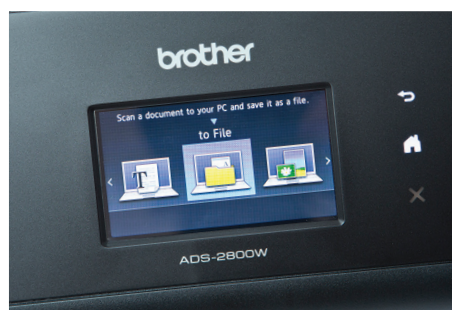
La fonction Secure Lock Fonction permet aux utilisateurs d'améliorer la gestion et la sécurité de leurs documents.