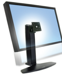
Support grand écran Neo-Flex