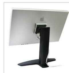
Le socle Neo-Flex avec mouvement vertical pour écran large peut porter un grand écran jusqu'à 91,5 cm et permet un mouvement vertical de 13 cm