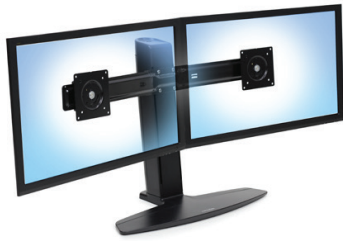
Support bi-écrans LCD Neo-Flex