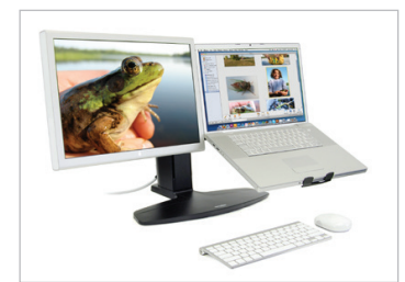
Le socle Neo-Flex combiné avec mouvement vertical peut porter un écran à côté d'un ordinateur portable, placé à gauche ou à droite. Il s'utilise avec un clavier et une souris séparés (non inclus)

© 2014 Ergotron, Inc. rev. 18/09/2014/FR Contenu sujet à modification sans avis préalable, photos non contractuelles