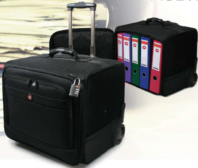
40L capacity / 1 binder shelve Capacité de 40L / 1 étagère a classeurs