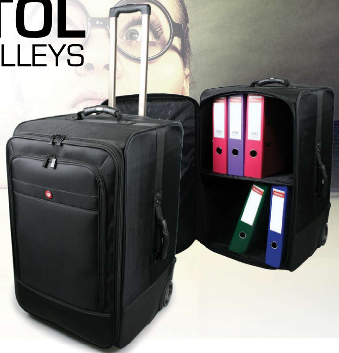
85L capacity / 2 binder shelves Capacité de 85L / 2 étagères à classeurs